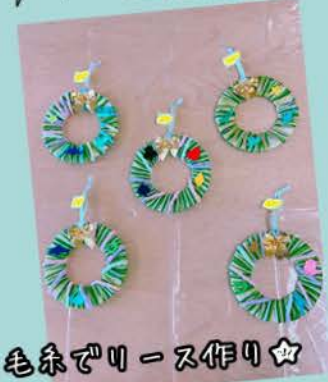
毛糸でリース作り☆