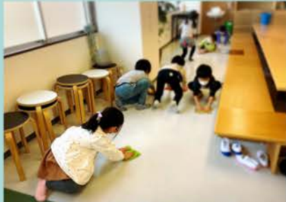
みんなでぐらんりんくを 大掃除!! (~*) ピカピカになりました!