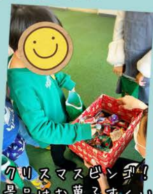
クリスマスピンゴ! 景品はお菓子すくい☆