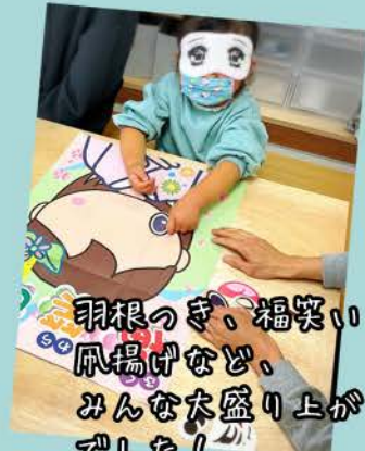
羽根つき、福笑い、 凧揚げなど、 みんな大盛り上がり でした!